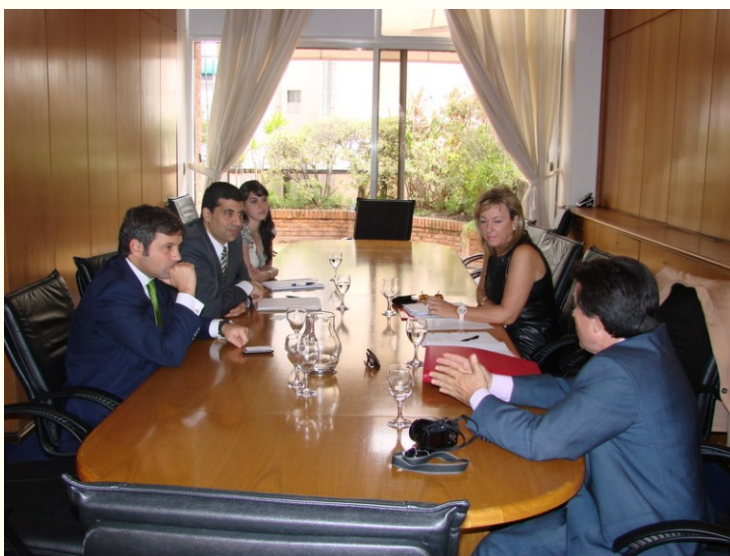
Un momento de la reunión mantenida con los representantes del Ministerio de Relaciones Exteriores de Argentina.