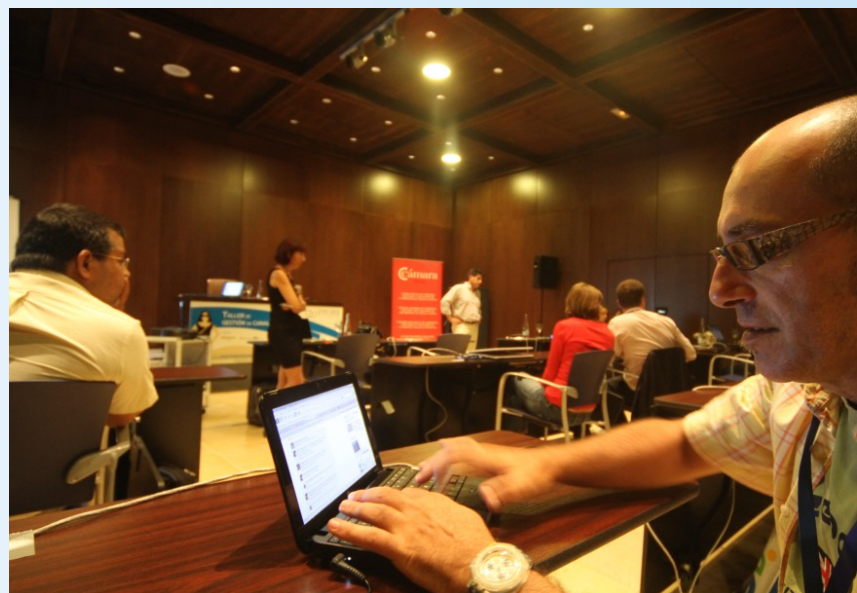
Los dos Talleres de “Aceleración Empresarial” tuvieron una gran acogida por parte de los profesionales participantes.