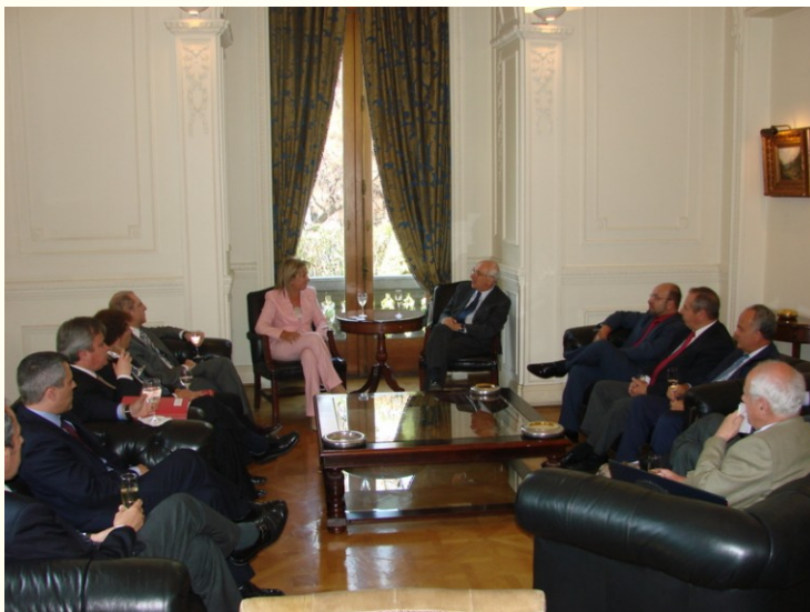
La delegación malagueña durante su visita a la Cámara de Comercio Nacional de Chile.

En el aspecto institucional, igualmente se ha desarrollado un amplio programa de reuniones y contactos al más alto nivel con autoridades y representantes de los dos países visitados, que han generado muy buenas expectativas.