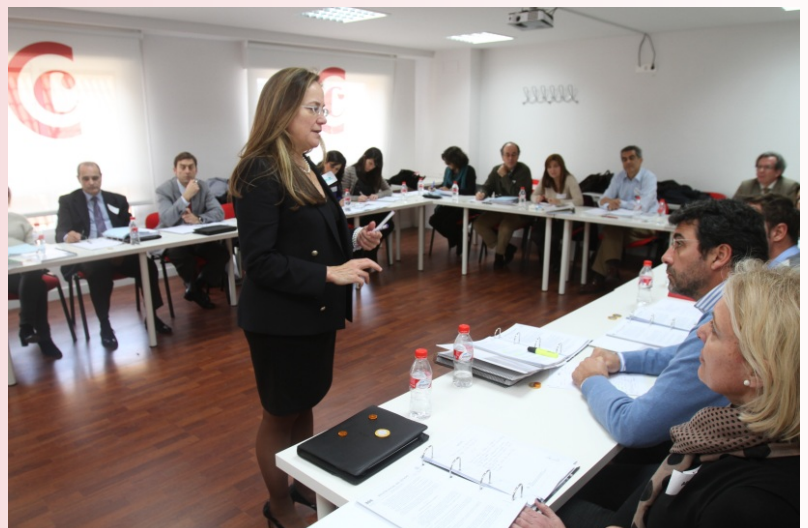
Esta jornada formativa se desarrolló en las instalaciones de la Escuela de Formación Empresarial de la Cámara de Málaga.

El proceso de mediación puede concluir con acuerdo o sin acuerdo y finalizará bien porque todas o alguna de las partes ejerzan su derecho a dar por terminado el proceso, comunicándolo al mediador, bien porque haya transcurrido el plazo máximo acordado por las partes, cuando el mediador aprecie de forma justificada que las posiciones de las partes son irreconciliables o por otras causas que determinen su conclusión.