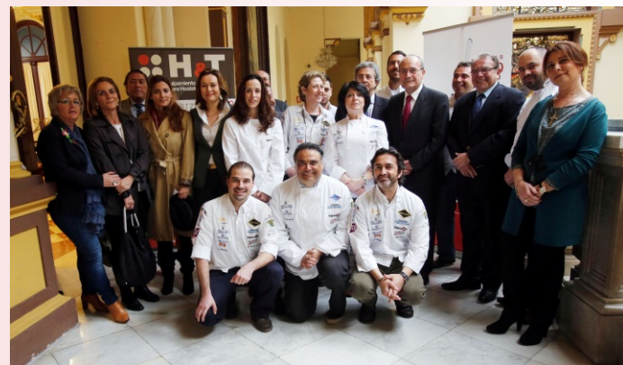
La presentación contó con la asistencia de representantes institucionales y miembros de Gastroarte.

El evento, organizado por el Palacio de Ferias y Congresos de Málaga dependiente del Área de Economía, Hacienda del Ayuntamiento de Málaga- está promovido por la colaboración de la Asociación de Empresarios de Hostelería de Málaga (AEHMA); la Asociación de Empresarios Hoteleros de la Costa del Sol (AEHCOS) y la Asociación de Empresas de Playas de Málaga (Aeplayas), patrocinado por Turismo Andaluz, Patronato de Turismo de la costa del Sol y Cámara de Comercio, Industria y Navegación de la Provincia de Málaga. Además cuenta con la colaboración de Gastroarte.