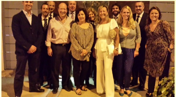
Debido al robo de las pertenencias, esta es la única imagen que poseemos del grupo empresarial malagueño en tierras africanas.