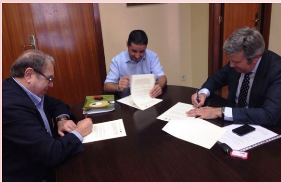
Momento de la firma de la adenda al Convenio, por la que se amplía la inversión prevista.