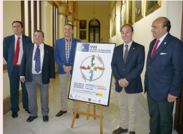
Momento de la presentación de las VIII Jornadas de Seguridad, Defensa y Cooperación en el Ayuntamiento de Málaga.