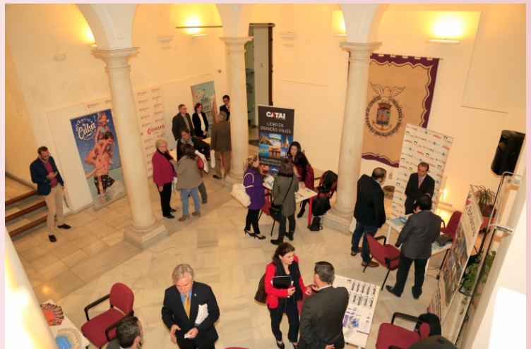
Imagen del workshop desarrollado en el patio de la sede de la Cámara de Comercio de Málaga.

Actualmente, hay más de 200 empresas españolas de pequeño y mediano tamaño en Cuba, de hecho, España es el tercer socio comercial del país sólo por detrás de China y Venezuela, y lidera las relaciones comerciales entre Cuba y Europa.