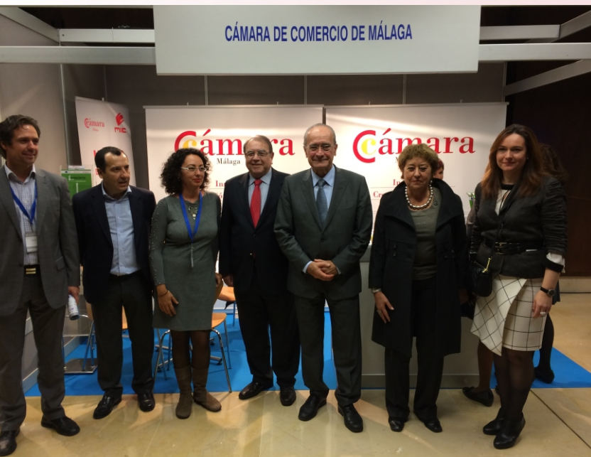
El alcalde de Málaga, Francisco de la Torre, y el presidente de la Cámara, Jerónimo Pérez (ambos en el centro de la imagen), durante la visita a nuestro stand junto a otras autoridades.

Los stands del Consejo Andaluz y de la Cámara de Málaga atendieron una gran cantidad de peticiones de información