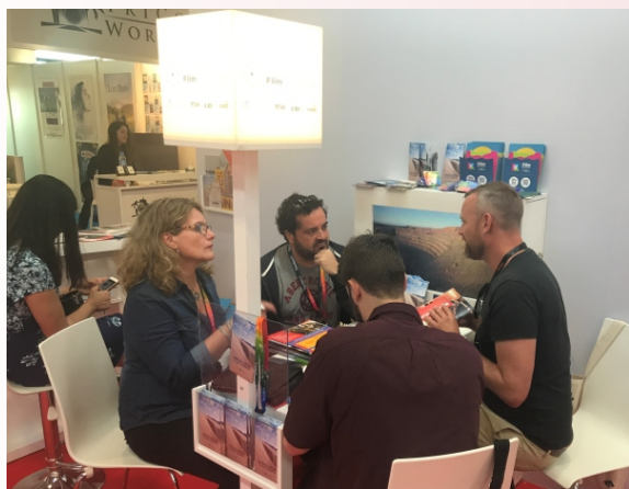
Representantes de Danidogfilms y Andalucía Film Commission en uno de los encuentros celebrados en la pasada edición de la Marché du Film de Cannes.

Como planes y expectativas para el futuro quisiera resaltar diferentes proyectos de campañas publicitarias, así como videoclips, pero principalmente dos proyectos de largometraje en coproducción minoritaria de ficción para este 2017 y 2018; así como terminar de levantar la financiación y la coproducción internacional del proyecto que llevo por bandera y prioritario en desarrollo como es “Y si Adán no quiere a Eva”, para filmar a finales de 2018 o principios de 2019.