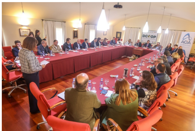
Un momento del encuentro entre el Comité Ejecutivo de la Cámara, el alcalde de Antequera y empresarios.

El equipo de gobierno de la Cámara tiene entre sus principales objetivos hacer llegar más y mejor los servicios que la Cámara ofrece tanto a empresarios como a emprendedores y personas que buscan empleo en la demarcación de la Cámara, la provincia de Málaga.